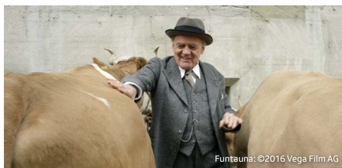
Bruno Ganz en «Un juif pour l'exemple» da Jacob Berger