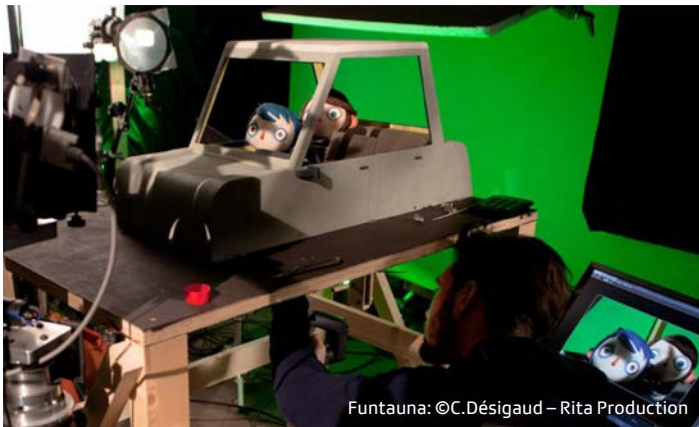
Preparaziun per filmar «Ma vie de Courgette»