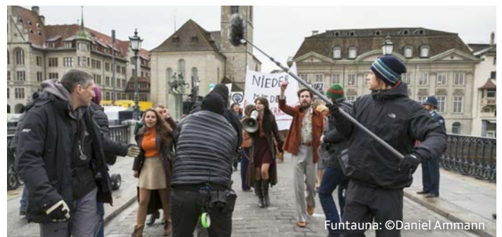
Lavurs da registraziun per il film «Die göttliche Ordnung»