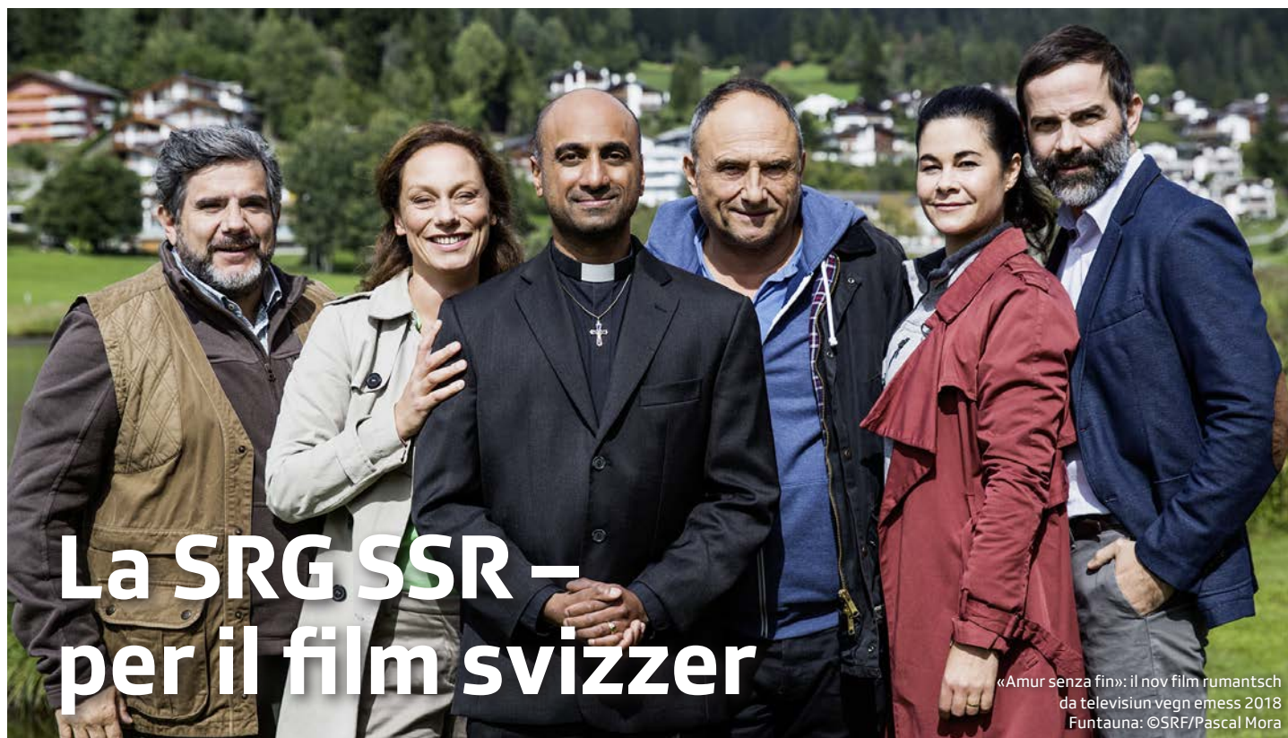
«Amur senza fin»: il nov film rumantsch da televisiun vegn emess 2018

Dapi il 1997 vegn reglada la collavuraziun tranter la branscha da film svizra e la SSR cun in contract – il Pacte de l'audiovisuel.